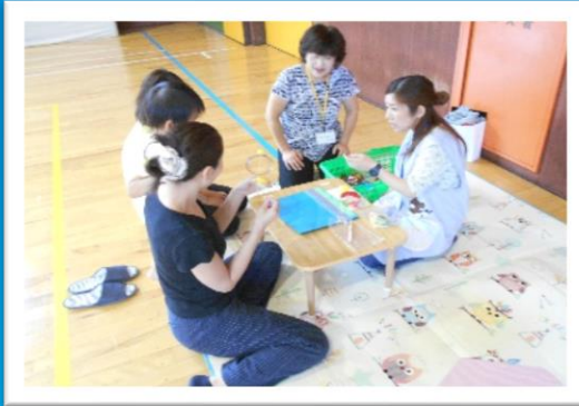
子ども遊び学び塾（ドッチボール、工作活動等）