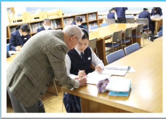
放課後学習サポート事業 中学生への学習支援