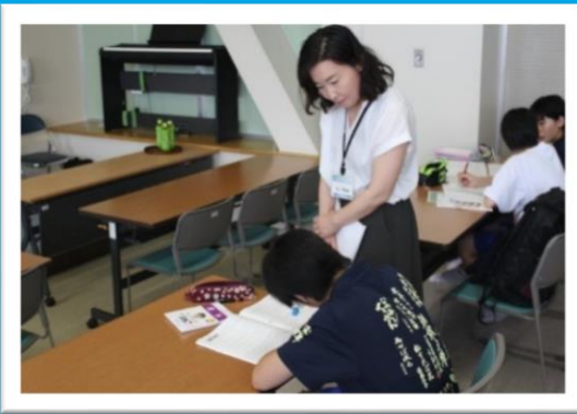
長期休業中の中学生への学習支援 「学週間」