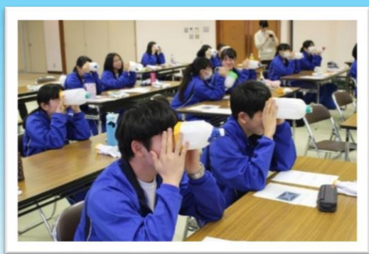
ハートふ.る.る 2days 「のそいてみよう知的障がいの世界」

未来の創り手である子どもの育ちを軸とした地域学校協働活動が、 これまで以上に人と人のふれあいを充実させ、 笑顔あられるまちづくりに貢献できたら いいなと願っています。