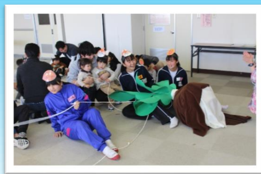
ハートふ.る.る 2days 「親子遊び支援の体験をしよう！」