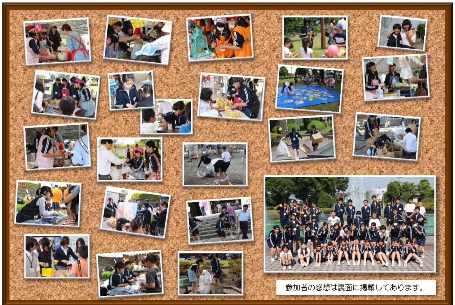
参加者の感想は裏面に掲載してあります。

参加した中学生と高校生にとって、たくさんの人の笑顔と「ありがとう」という言葉が、何よりのご褒美となりました。