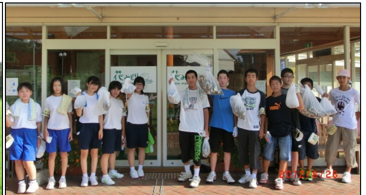
上: わんぱく公園「はなばなのまち」の清掃を担当した中学生。 左: 活動後、町長・教育長から感謝のこたば。記念の一枚。