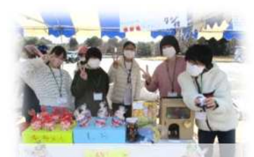
イベントでの出店