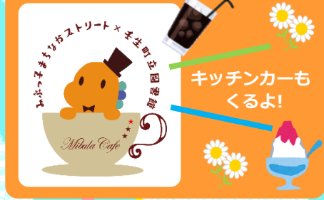
キッチンカーもくるよ！