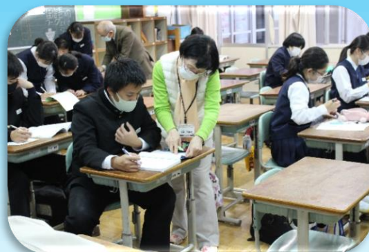
令和2年度 放課後学習サポート事業 南犬飼中学校