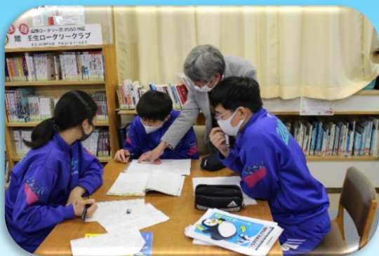
令和2年度 放課後学習サポート事業 壬生中学校