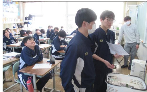
真剣に意見を述べる3年4組の代表生徒