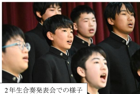
2年生合奏発表会での様子

また、今回の立志式に併せて、12月に2学年だけ実施できなかった合唱発表会も同時に開催しました。どのクラスも熱い思いを胸に、熱唱を繰り広げ、素晴らしいハーモニーが体育館全体に響き渡りました。4年ぶりの合唱でしたが、幸せな時間を生徒、保護者、教職員で共有できたことに感謝します。