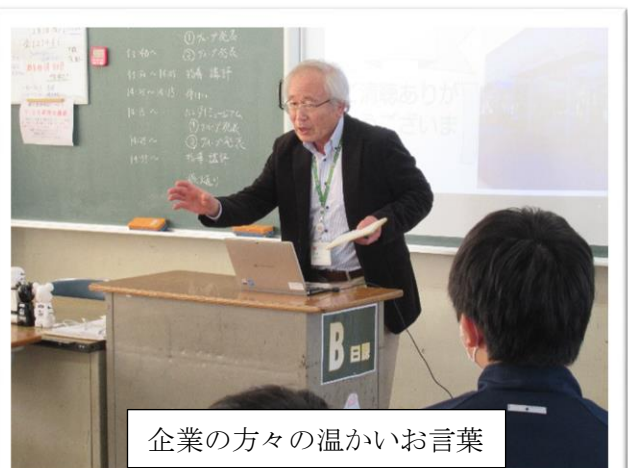
企業の方々の温かいお言葉