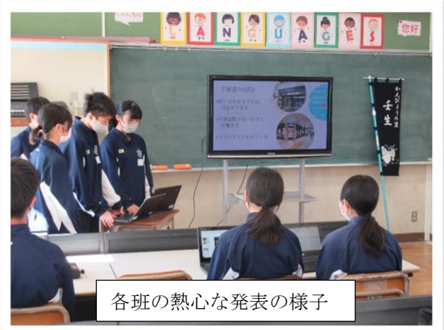
各班の熱心な発表の様子

2月2日(金)、5、6校時、第2学年の総合的な学習の時間の授業で、各企業の方々をお招きして、最終発表会を行いました。各班が、それぞれの課題に対して、試行錯誤を繰り返しながらスライドを作成して、プレゼンテーションを行いました。発表会では「この活動を通して、どんなことを感じましたか?」「大人になったときに、子どもたちにどんなことをしてあげたい?」などを質問されて、「壬生町を活性化させたい」「地域の人を楽しませたい」「地域を盛り上げたい」「地域に貢献がしたい」と堂々と答えている生徒の様子を嬉しく思いました。各企業の方々から、生徒達の素晴らしい発表に対して、お褒めの言葉をたくさんいただき、とても有意義な時間を過ごすことができました。この1年間、生徒達とともに地域の特徴を見つめ、子どもたちに自分自身を見つめさせ、可能性を引き出す様々な取り組みを実施して、体験活動をさせていただいた各企業の方々に心より感謝申し上げます。