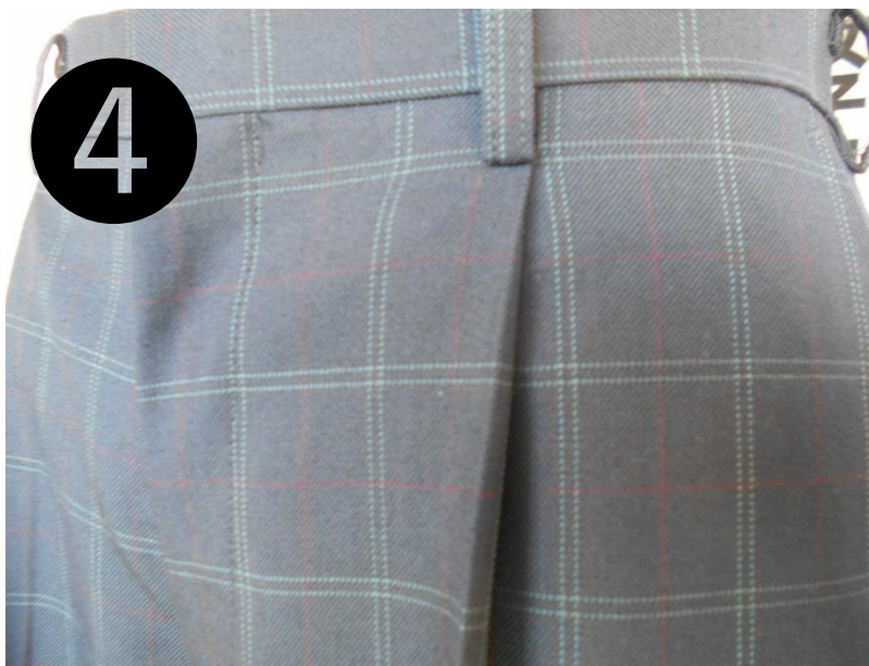
小さめのチェック ・ 陽炎(赤) ・ 若草(緑)