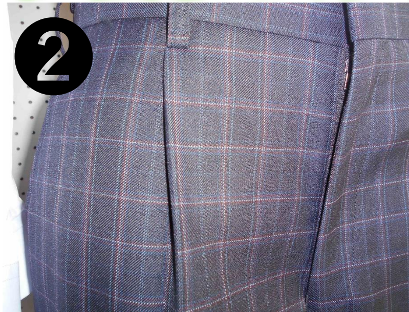
小さめのチェック ・ 陽炎(赤) ・ 黒川(青) ・ 白亜の校舎(白)