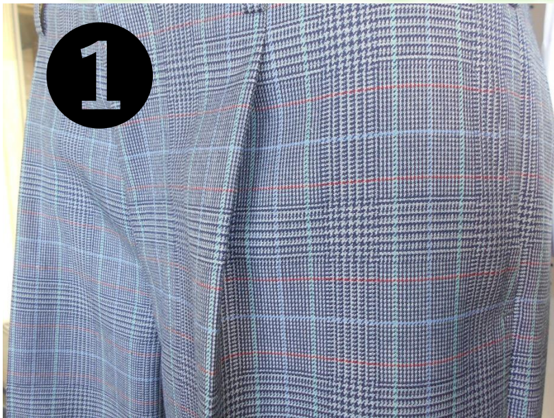
グレー地 ・ 陽炎(赤) ・ 黒川(青) ・ 白亜の校舎(白)