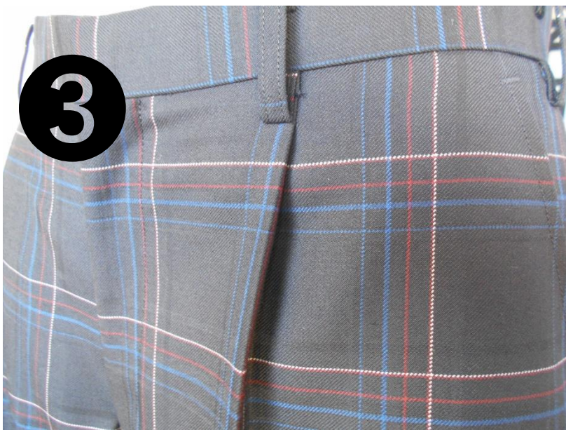
大きめのチェック ・ 陽炎(赤) ・ 黒川(青) ・ 白亜の校舎(白)