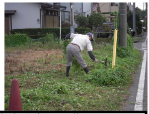
臨時駐車場の草刈りをしてくださるボランティアさん