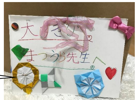
メッセージアルバム