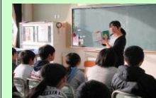
人権なかよし集会