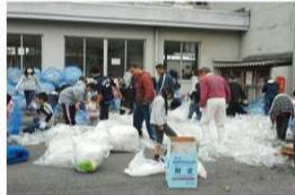
大量のペットボトルをつぶしています。

引き続き、どんど焼きのための「わら束ね」の作業にもお骨折りいただき、大変御苦労様でした。