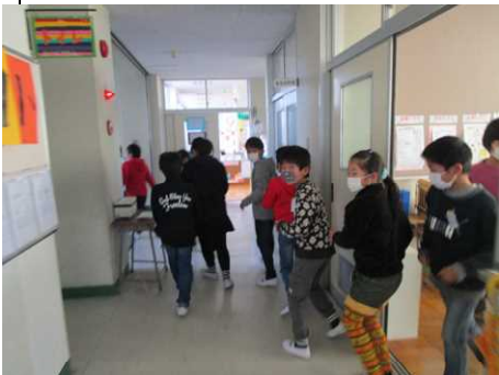
不審者侵入を受けて速やかに避難

今回は学校に不審者が侵入したときの対応と、1人で家にいるときや外に遊びに出かけたときの危険回避について学びました。私たちは常に「自分が危険な状態にあるとき、それに気づくこと」、「危険を回避するためにどう行動すればよいか考えること」を意識する必要があります。それは自然災害でも交通事故でも同じです。これまでの安全教室も振り返りながら、意識を高めていきたいと思います。