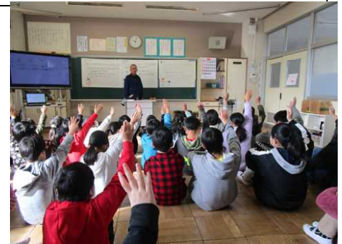
クイズ形式で危険回避を勉強