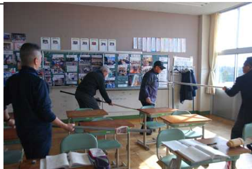
教室では不審者取り押さえ訓練