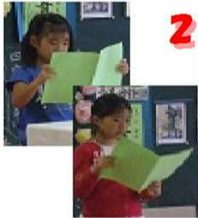
〈始業式代表児童 作文発表〉

ひと足早い秋の訪れを感じますが、2学期がスタートして学校も活気が戻ってきました。 この夏休み、どの子も事故なく安全に過ごすことができ何よりでした。特に全校合奏の取り組みは、テレビや新聞でも紹介され、「羽生田小パワー」を再確認することができました。 2学期は、この全校合奏の頑張りを生かして「一致団結」、さらに、多方面で羽生田小のよさを発揮してほしいと思います。 2学期は、音楽祭・運動会等、児童の活躍の場がたくさんあります。引き続き、御支援、御協力よろしくお願ひいたします。