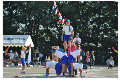
<はねっこソーラン組体操>