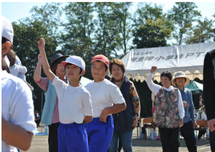
<羽生田じゃんけん大会>

抜けるような青空の下、はにしの里大運動会が開催されました。地域との共催で行われる第2回目の運動会でした。学校は、全員が一致団結し、集団行動を行う美しさを見ていただきました。さらに、地域とは、一体となった楽しく思い出に残る運動会を目指しました。今年度はさらに「羽生田じゃんけん大会」を計画し、皆様が一体となれるように計画しました。今回の運動会は、1年生にとっては初めての運動会、6年生にとっては最後の運動会です。どの子どもたちも努力する姿はとてすばらしく、羽生田小学校の協力する集団行動をお見せできたのではないかと思います。開会式から始まり、準備運動、徒競走、障害走、団体、はねっこソーラン、全校合奏、リレー等、どの種目を見ても、とてもすばらしかったです。それを盛り上げてくれた応援団は、6年生・5年生が休み時間を削って頑張っていました。高学年の活躍が、羽生田小学校を支えていると思います。地域の種目もスムーズに集合していただき、楽しく行うことができました。保護者の皆様には、前日の準備から後片付けまでお手伝いいただきお礼申し上げます。また、地域の皆様にも御協力いただき、楽しい充実した運動会を行うことができました。厚くお礼申し上げます。これからも御協力・御支援よろしくお願ひします。