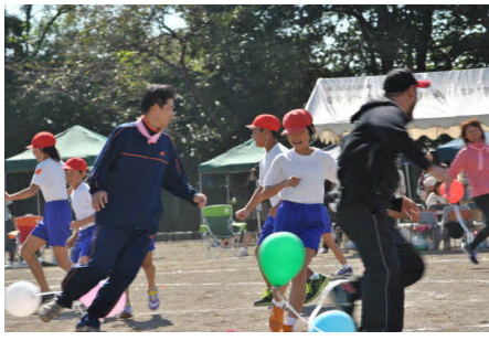
<バルーンファイト>