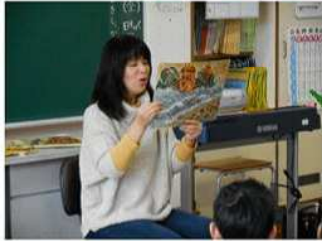
〈低学年・小牧さん〉