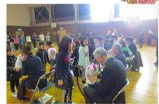
〈鉢花のプレゼント〉