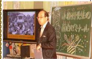
〈身近な幸せを確認〉