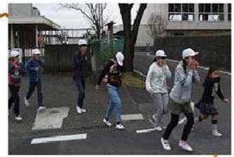
〈先生が居なくても…〉

今回は、児童に予告なしでの避難訓練でしたが、今までの訓練が生かされ「おさない・かけない・しゃべらない・もどらない」をよく守り落ち着いて行動できました。