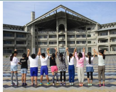
10人の絆が深まりました。