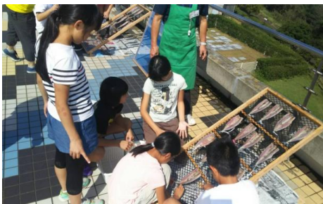
さんまの干物づくり体験