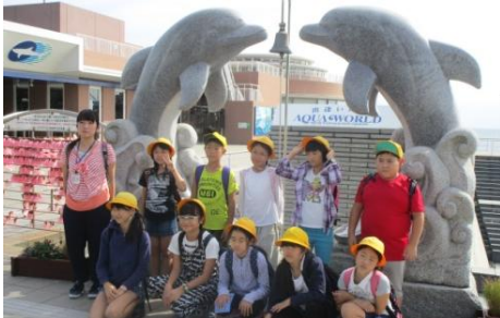
アクアワールド大洗にて