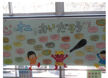
< 掲示板から >

2月1日にすけが保育園に行ってきました。毎年1・2年生が交流しています。日本の伝統行事の豆まきを保育園児と一緒に楽しむことができました。本校でも階段の踊り場に「心の鬼をおいだそう」ということを載せて全児童で取り組んでいます。御来校の折にはぜひ御覧ください。