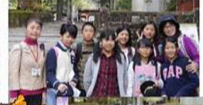
5・6年 日光 10/30(金)