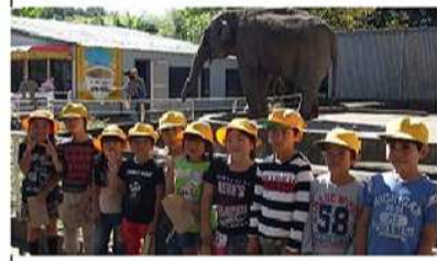
10/28(水) 1・2年宇都宮動物園