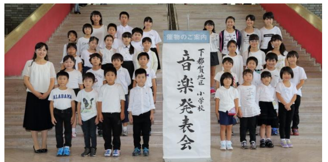
郡音楽祭に向けての最終リハーサル（当日の朝）