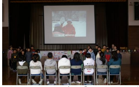
6年生からリコーダー「カノン」の演奏・歌「歌よありがとう」のプレゼント