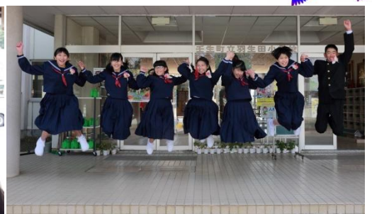
6年生 羽小で最後のジャンプ