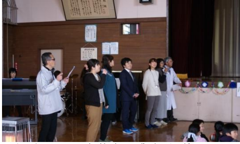
5年生による涙涙の感謝状贈呈

教職員による歌「さくら」のプレゼント 在校生による歌「友よ」・懐かしい映像・メッセージのプレゼント