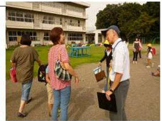
引き渡し者を確認し児童を確実に引き渡せるようにする訓練です。