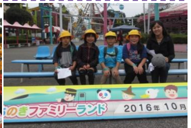
とちのきファミリーランド 2016年10月28日