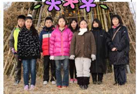
〈こんなに大きく成長しました〉

小学校生活もあとわずかですが、羽生田小の「よさ」をたっぷり身に付けて、羽生田小の子らしく「明るい笑顔」で、大きく羽ばたいて行ってほしいと思います。