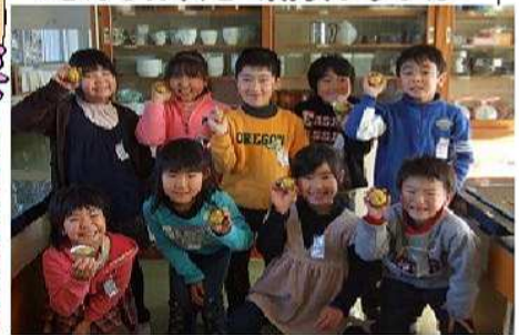
〈卒業生1年次〉 なんとあとけないことか！

どの子ども真剣そのもの。「自分の命は自分で守る」、この大切な学習を繰り返し行うことで、万一来るべき時に備える力を育てたいと思っています。