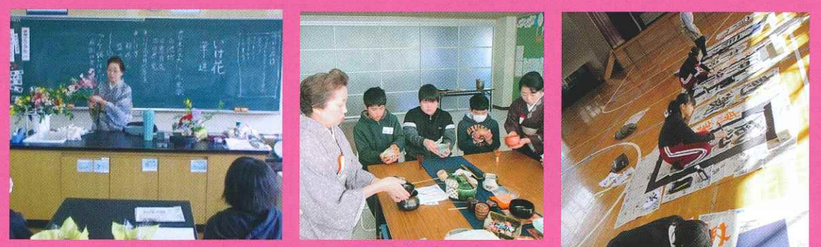
華道体験 茶道体験 書道教室

プロの技を直近に見て体験することで、豊かな感性を育てるとともに子供たちの夢を育てています。