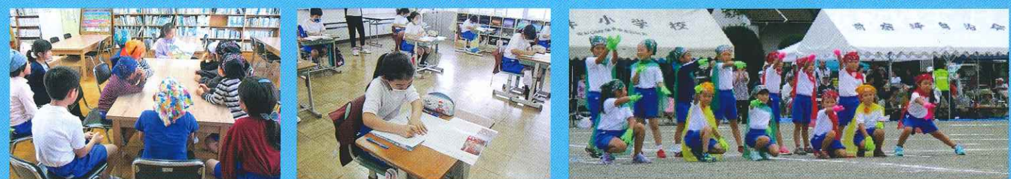
図書委員読み聞かせ わかるまでじっくり考える みんながヒーロー