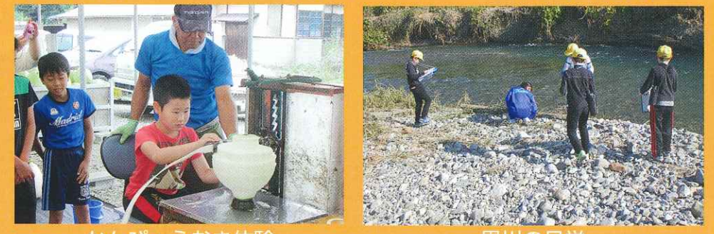
かんぴょうむき体験 黒川の見学

恵まれた地域の環境を学習に生かしています。少人数のため、子どもたちが疑問に感じたことを実際に見学したり、体験したりして学びを深めています。