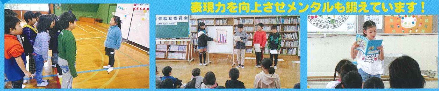
来入児との交流会 給食保健委員発表 短作文発表

小さい学校だからこそ一人一役 何度でも体験！！ 表現力を向上させメンタルも鍛えています！