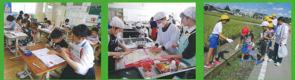
サマースクール（夏休み） 調理実習 クリーン活動

壬生高校と1・2年生はペーパークラフト体験を、3・4年生は点字・手話を、5・6年生は調理実習を共に実施します。高校生と学習することでキャリア教育の充実を図っています。